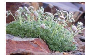
Manzanilla de Sierra Nevada

Las especies de flora de alta montaña son especialmente sensibles a los cambios ya que estas zonas funcionan como verdaderas islas de las que las plantas no pueden escapar hacia otros lugares con condiciones adecuadas. La Unidad se ordena según la ecología de cada planta.