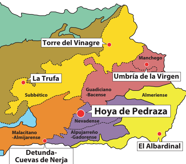
Distribución de los Jardines Botánicos de la Red Sectores Biogeográficos

La Red Andaluza de Jardines Botánicos y Micológico en Espacios Naturales apuesta decididamente por el desarrollo y aplicación eficaz de la Estrategia Mundial para la Conservación de la Naturaleza y el Convenio sobre Diversidad Biológica. Como centros de conservación, recuperación y reintroducción de especies silvestres, la Red participa en la estrategia de conservación de esta Consejería y coordina sus actuaciones con otros organismos e instituciones regionales, nacionales e internacionales como la International Association of Botanic Gardens (IABG) o la Asociación Iberomacaronésica de Jardines Botánicos (AIMJB).